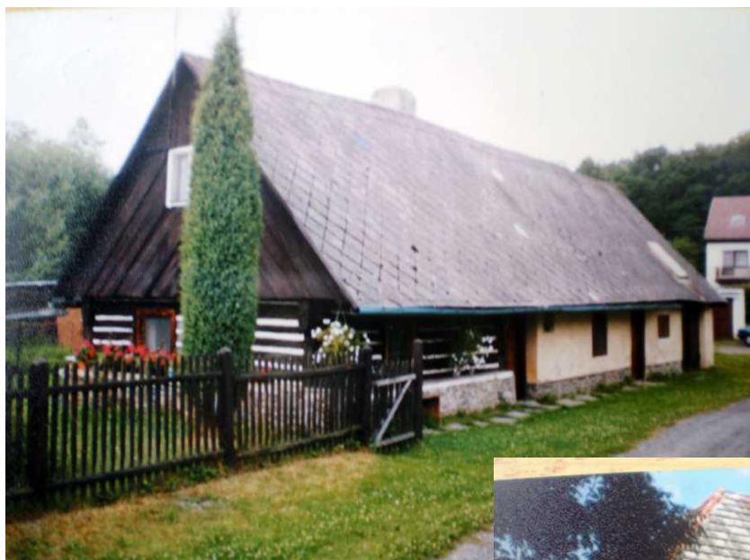
Dobronice, č. p. 1