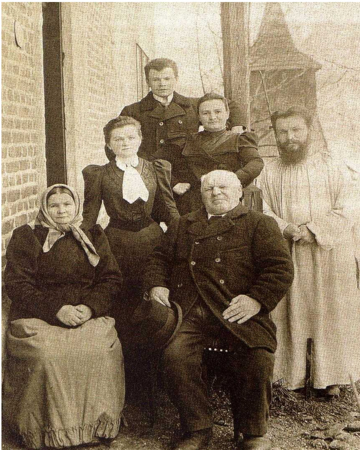
Sourozenci a rodiče, r. 1906