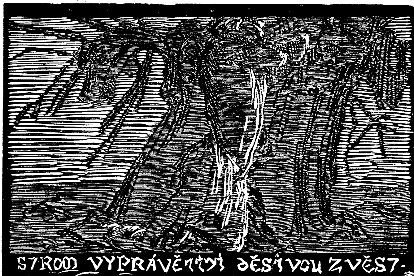
Obrázek ke článku Grafika Františka Bílka