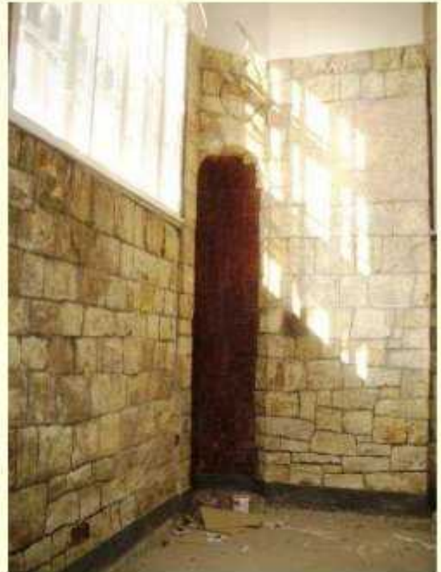
Restaurátorské práce na opukových stěnách v ateliéru.