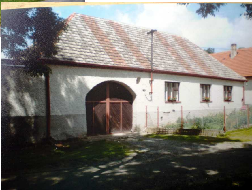
Nuzbely nad Hroby, č. p. 11