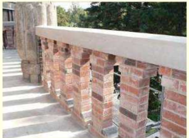
Obnova cihelného zábradlí balkonů.