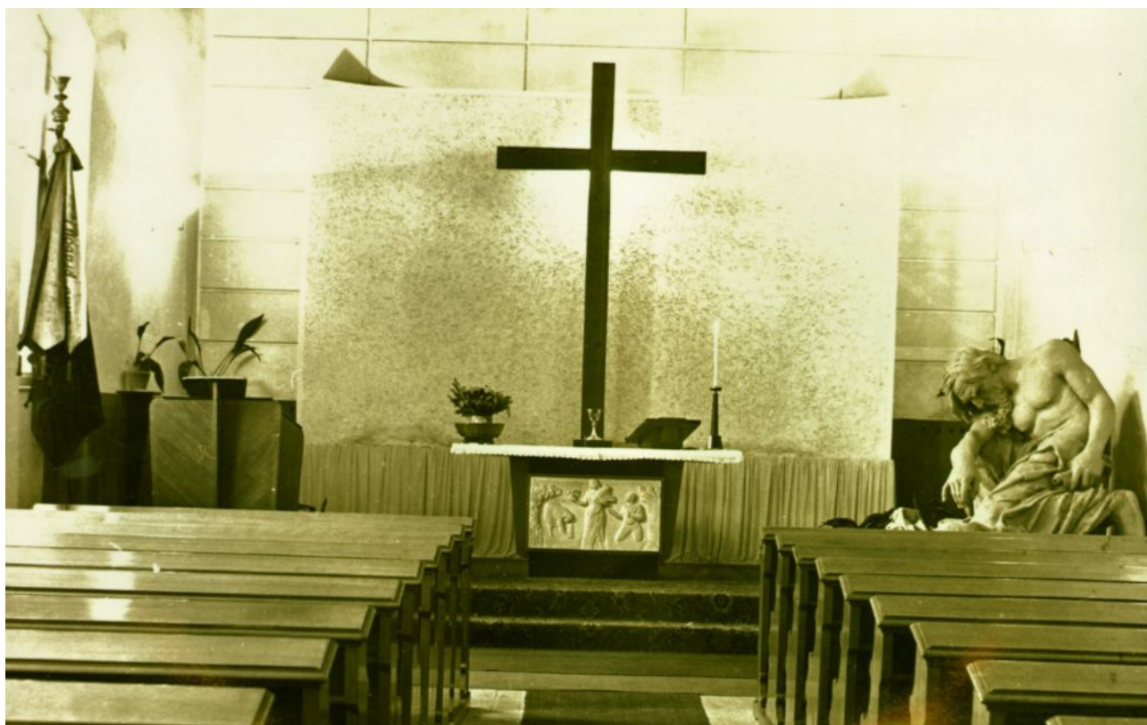
Dobový snímek plastiky Mojžíše v Husově sboru v Benešově, 1965.