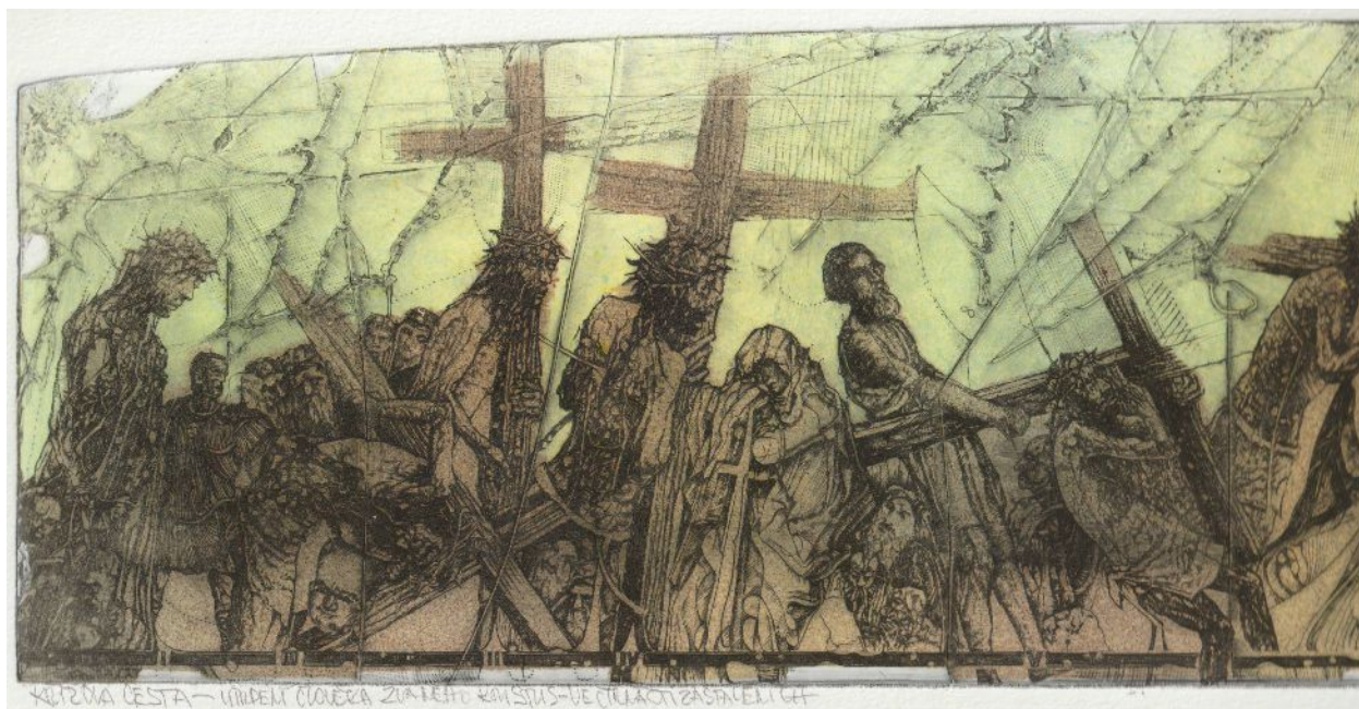
Pavel Hlavatý: Křížová cesta (detail z grafického listu). K článku na str. 9-11.

Obrázek na titulní straně: plastika F. Bílka „Mojžíš“ v pražské Pařížské ulici. K článku na str. 3-6.