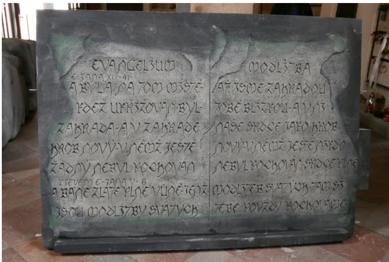
Novodobá replika Bílkova Božího hrobu – detail desky.