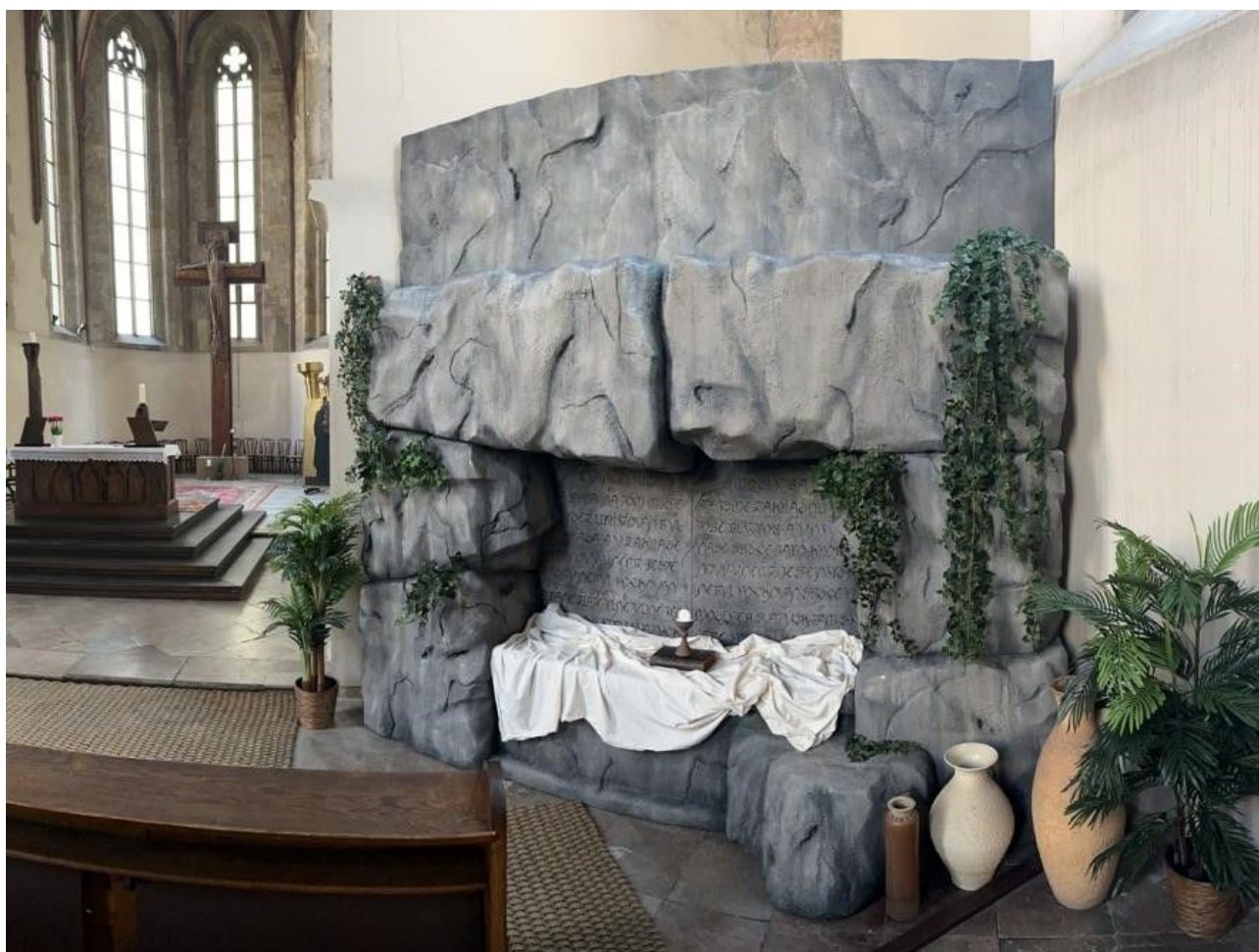
Novodobá replika Bílkova Božího hrobu – celkový pohled.