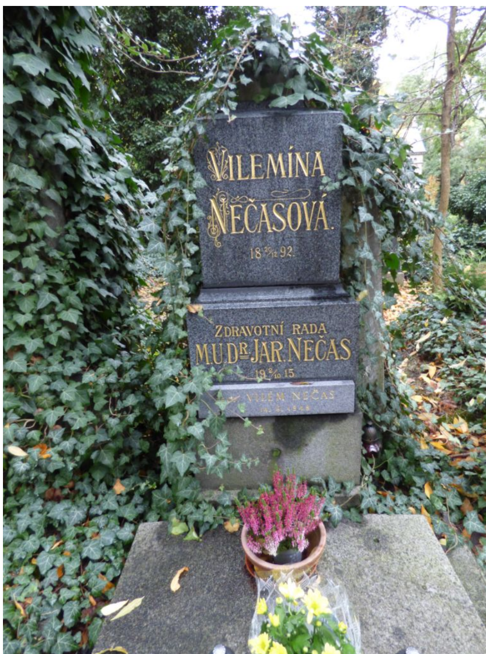
Hrob rodiny Nečasů.