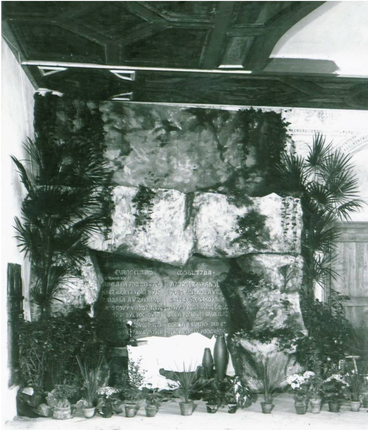
Bílkův Boží hrob – historický snímek z kostela sv. Václava Na Zderaze.