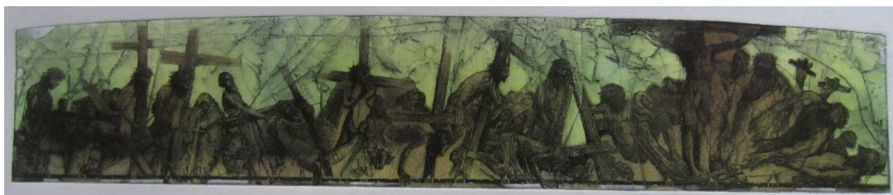
P. Hlavatý – Utrpení člověka zvaného Kristus ve čtrnácti zastaveních. 14x70cm, MT- kombinovaná grafická technika C3/C4/C5/color, 2023 náklad 40 tisků v různých barevných modifikacích cena: 3.500,-

Pavel Hlavatý, kontakt: hlatatyp@seznam.cz