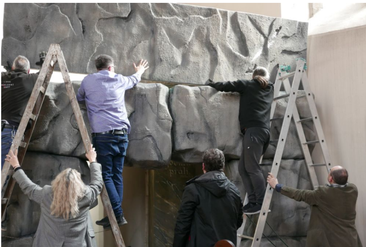
Stavba novodobé repliky Bílkova Božího hrobu.

Myslím, že vytvoříme Na Zderaze další velikonoční tradici. Boží hrob je naším majetkem. Díky štědrosti dárců jsme získali dokonalou maketu skály a hrobu, nakoupili další komponenty, které v instalaci jsou, a výsledek je, domnívám se, opravdu mimořádný. Troufnu si říct, že jsme v tuto chvíli jediným sborem v naší církvi, který Božím hrobem Františka Bílka připomíná nejen mystično pašijového příběhu smrti, vzkříšení a naděje víry ve Spasitele, ale také dílo fenomenálního umělce.