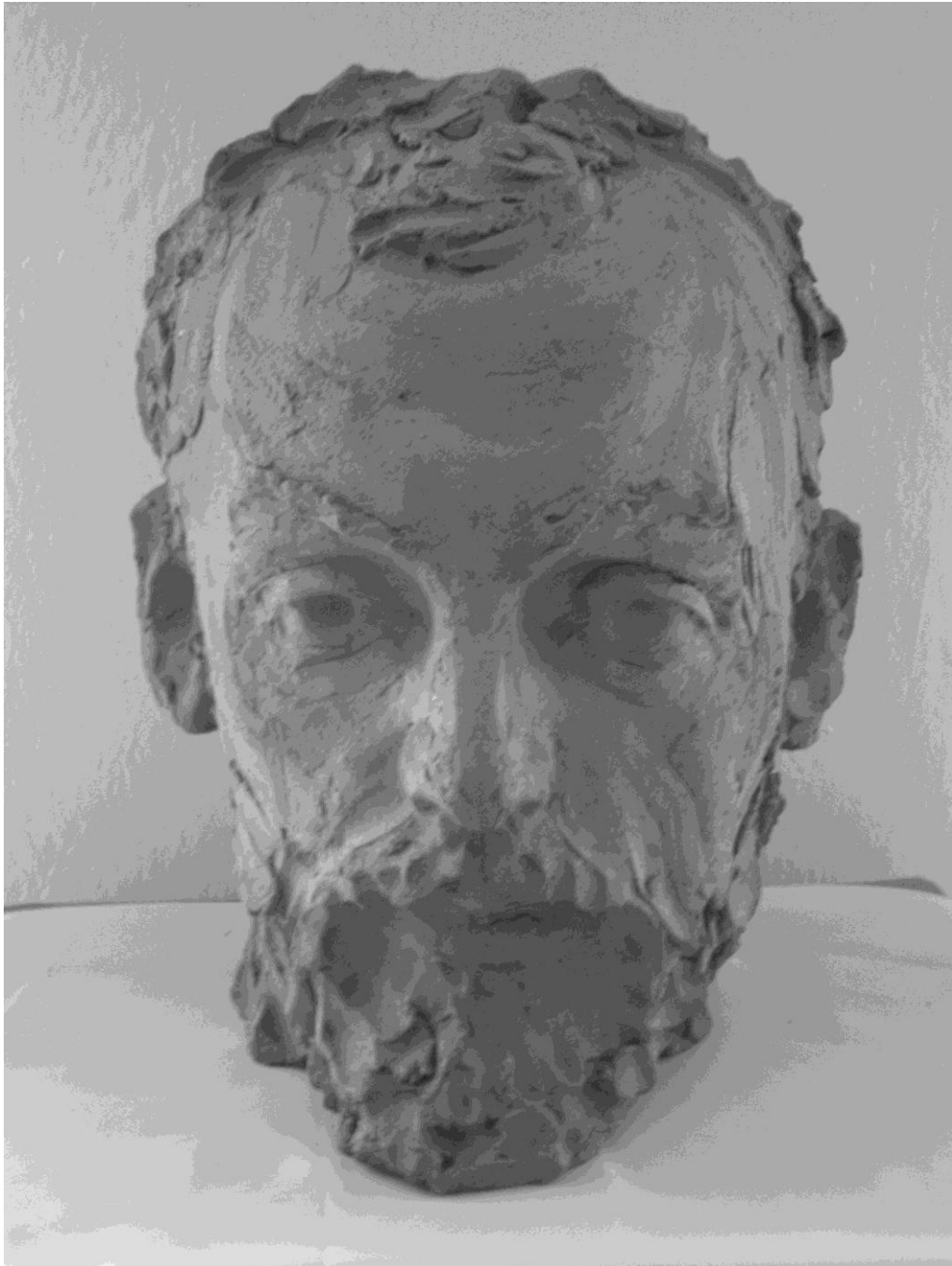
F. Bílek: plastika hlavy O. Březiny, pálená hlína, 1906.