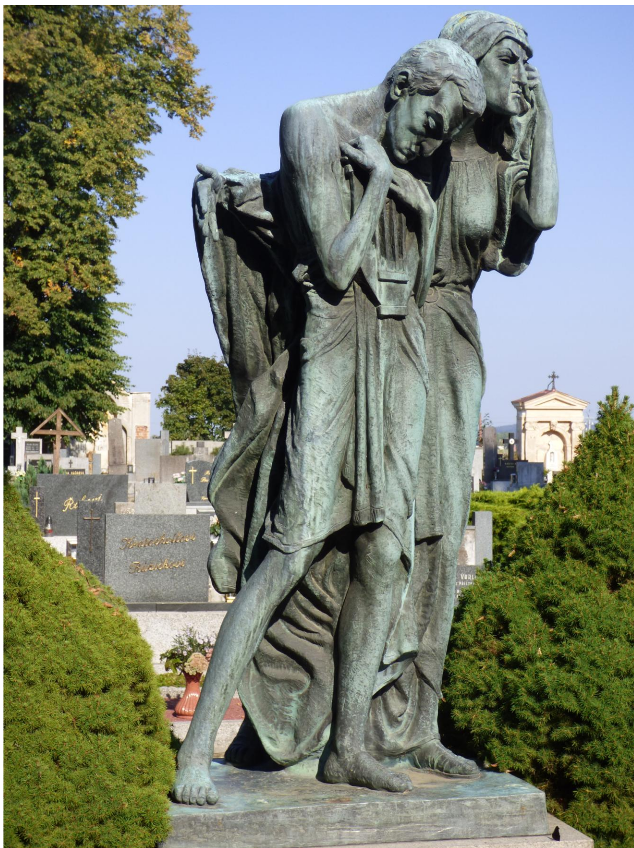
Bítkova plastika Tvůrce a jeho sestra Bolest na hrobě O. Březiny v Jaroměřicích, 1932.