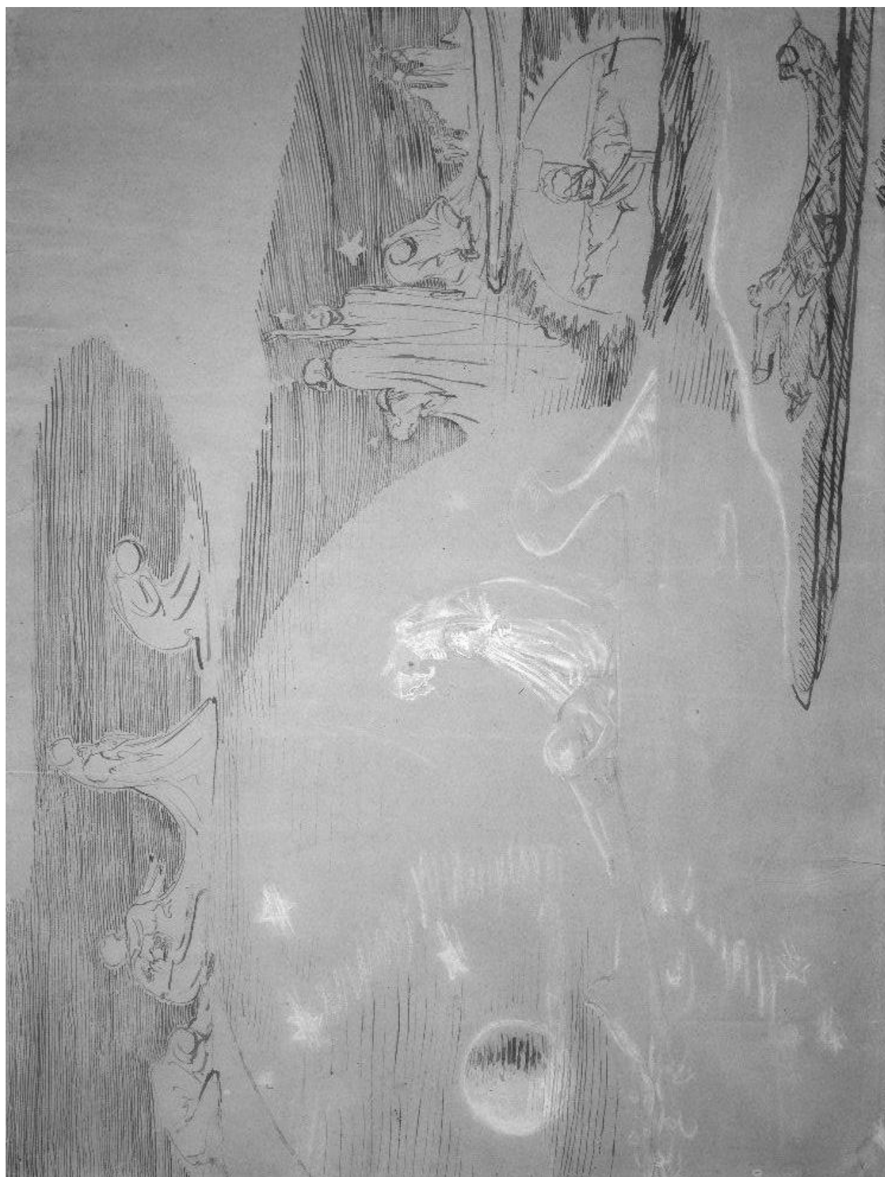
František Bílek: kresba Tichý oceán, 1901. Foto: F. Kožíšek.