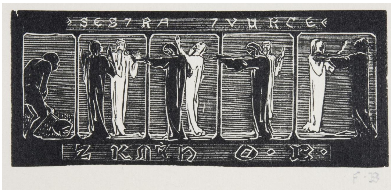
F. Bílek: exlibris pro Otokara Březinu, 1907.

Březinu a Bílka, ačkoli jsem o jejich hlubokém přátelství věděl od obou. Ale věc nebyla bez obtíží. Nevěděl jsem a nemohl ani přibližně určit, kdy budu uvolněn ze svých povinností školních a kdy tedy přes Chýnov pojedou. Musel jsem před svým odjezdem ukončit ještě různé práce, obnoviti konservování sbírek, které jsem spravoval, a obstarati mnohé drobnosti i ve školní zahradě, neboť kantor na lesnické škole nemůže odletěti na prázdniny jen tak jako z holubníku, sotva školník odzvoní poslední vyučovací hodinu. Napsal jsem to všechno poctivě Březinovi do Chýnova, odkud místo Březiny odpověděl Bílek, abych se jistě na cestě zastavil pod jeho střechem, kde budu bratrsky uvítán, kdykoli se tak stane.