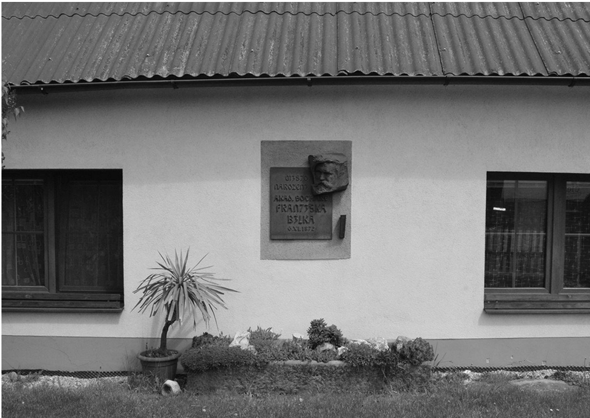
Rodný dům F. Bílka s pamětní deskou, foto: Ludmila Mikulová.

Oslava vyzněla jako důstojné uctění památky významného chýnovského rodáka a měla výraznou kulturní úroveň, vyjádřenou a hodnocenou i v tiskových člancích.