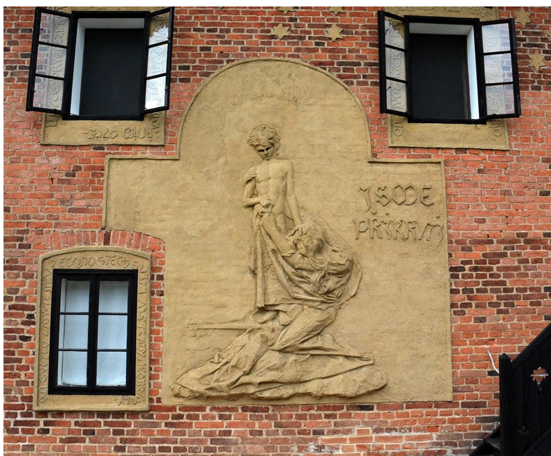
Reliéf „Jsme přikryti“ zdobící jednu stěnu chýnovské Chaloupky.

Obrázek na titulní straně: Málo známý Bílkův reliéf „Matko Pána mého“ v severním štítu domu rodičů a bratra F. Bílka.