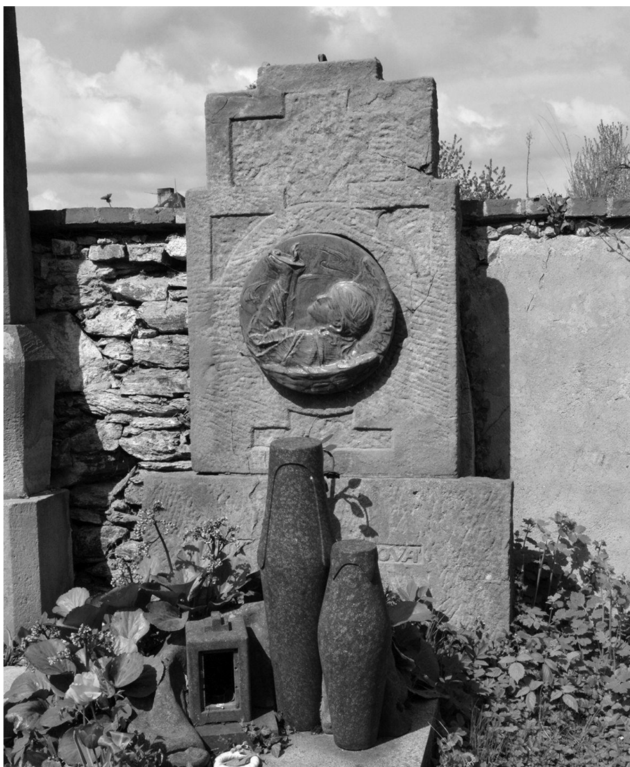
Jedna z Bílkových plastik na chýnovském hřbitově.

V rámci tradičního mezinárodního historického festivalu "Táborská setkání" bude dne 15. 9. 2018 šest táborských církví pořádat společně seminář a výstavu o Františku Bílkovi. Podrobnosti o této akci přineseme později na webových stránkách SFB.