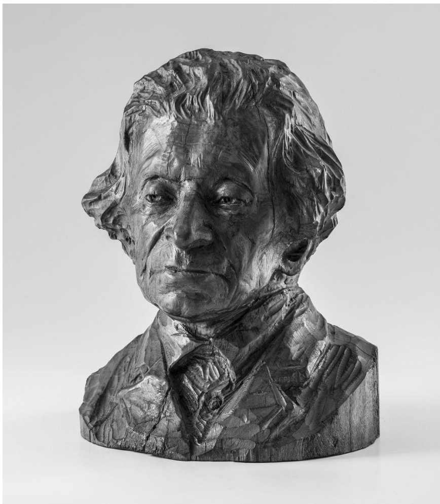
F. Bílek – Podobizna pana Guttmanna. Dřevo, 1895 nebo 1897.

Dílo také není spolehlivě vročeno. Uvádí se rok 1895 i 1897. V prvním případě jde mimo jiné o brožuru František Bílek. Dům v Chýnově z roku 2009, ale časové určení plyne i z Nečasova Svědectví a edice korespondence Básník a sochař . V druhém případě jde o evidenci sbírkových předmětů Galerie hlavního města Prahy (GHMP), respektive Bílkovu monografii z roku 2000. Mohlo se pak jednat o posmrtný portrét, což je spíše méně pravděpodobné.