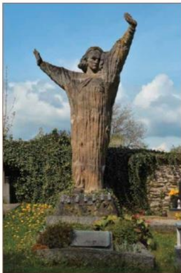
Po stopách Františka Bílka na jihu Čech

Společnost F. Bílka, díky velkorysé podpoře společnosti ČEVAK, vydává v červnu 2018 turistickou mapu „Po stopách F. Bílka na jihu Čech“, ve které najdete všechna místa v jižních Čechách a přilehlém okolí, která jsou významně spojena s životem Bílka nebo na kterých lze dnes najít jeho díla. Mapa bude v elektronické podobě dostupná na webu SFB ( www.spol-fb.cz ), v tištěné podobě bude k dostání na akcích SFB, v městské knihovně v Chýnově a ve vybraných jihočeských muzeích a infocentrech.