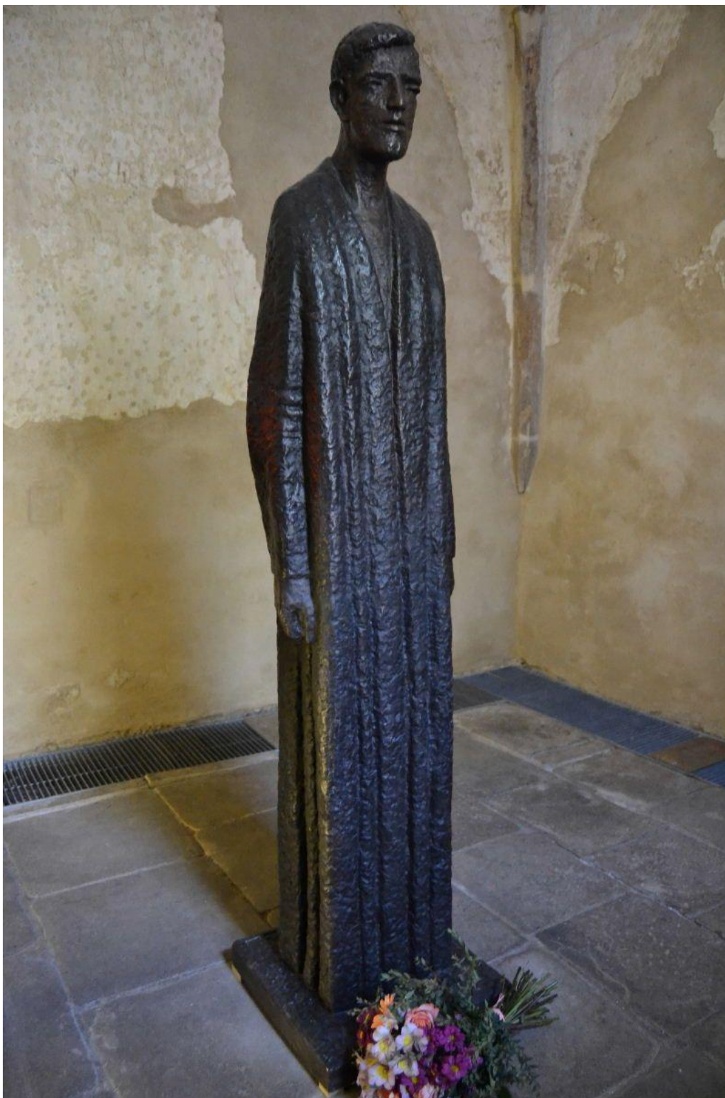
Socha pro Josefa Toufara v kostele sv. Víta v Zahrádce, poslední dílo Olbrama Zoubka (2017).