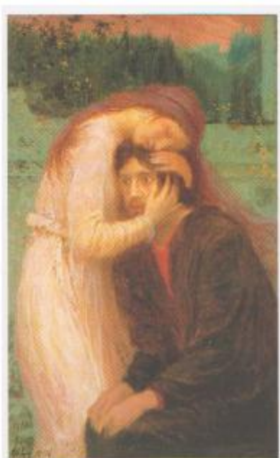
Max Švabinský - Splynutí duší (1896)

Výtvarník Pavel Hlavatý připravuje pro městskou galerii v Čáslavi ( http://www.cmuz.cz/Muzeum/galerie.htm ) velkou výstavu „ Pozdní český symbolismus v grafické tvorbě první poloviny 20. století “, která se bude konat ve dnech 15. 8. – 11. 9. 2016. Na výstavě nemohou chybět ani díla Františka Bílka, jehož kresby se objevují i na plakátě a pozvánce na výstavu.