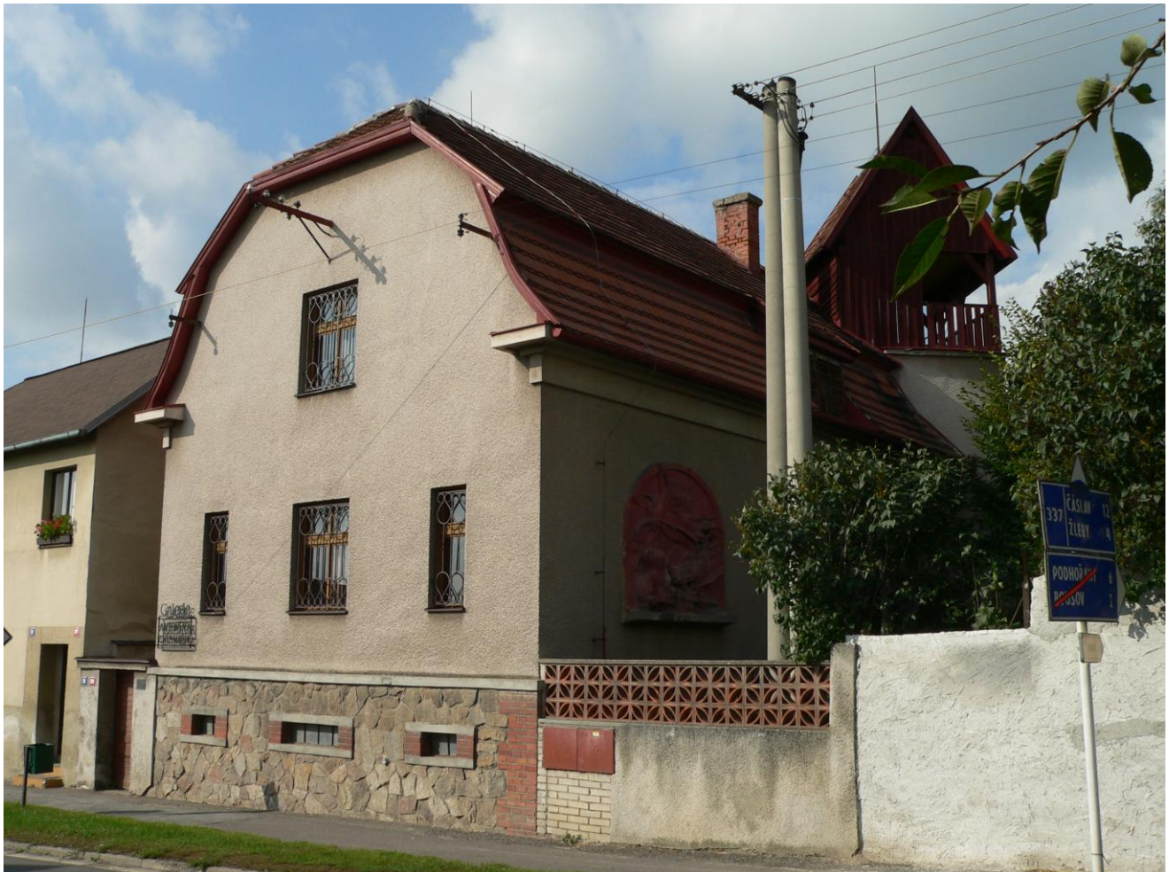
Nečasova vila, pohled na průčelí domu z ulice.