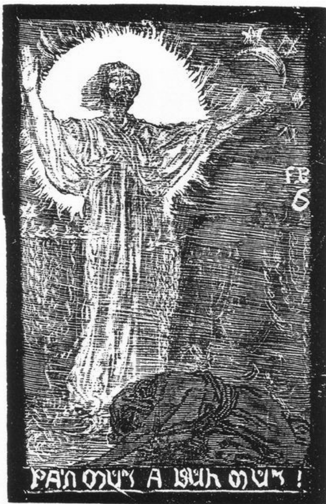
Dřevoryt „Pán můj a Bůh můj“ z cyklu Moje pohádka.

Nakonec to v mezích možností dobře dopadlo, včetně obálky, jejíž celou plochu zabírala celostránková kresba polopostavy Komenského, velmi připomínající optický dojem z kolínského Husa. Traktát samotný doplnil doslovem Arne Novák... (str. 119-120)