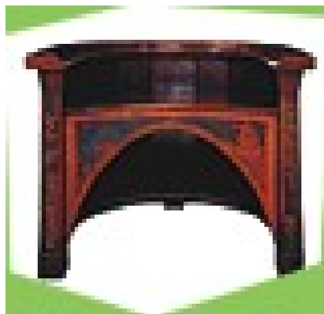
dvě ukázky nábytku navrhovaného Františkem Bílkem, který je vystavován v Troji (viz následující strana)