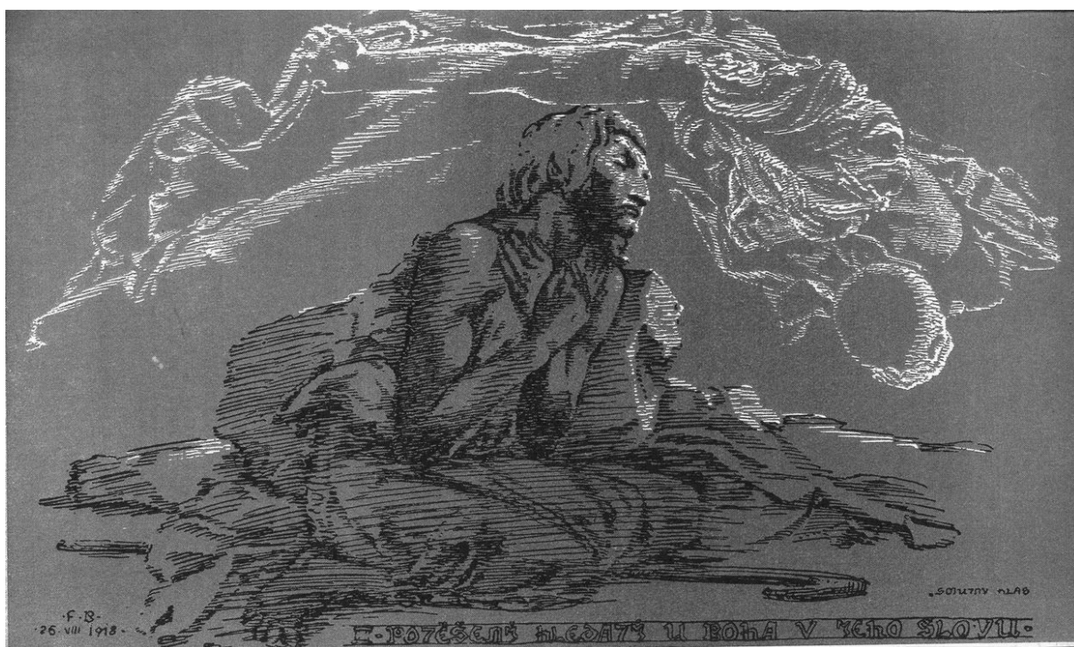
Kresba „Smutný hlas“ ke stejnojmennému dílu J.A.Komenského.

Tím, že k vydání Knihy nedošlo, padl i projekt na vydávání její Edice a mně nezbylo než vrátit všechny rukopisy s omluvou, že z technických důvodů atd. atd... (str. 58-59)