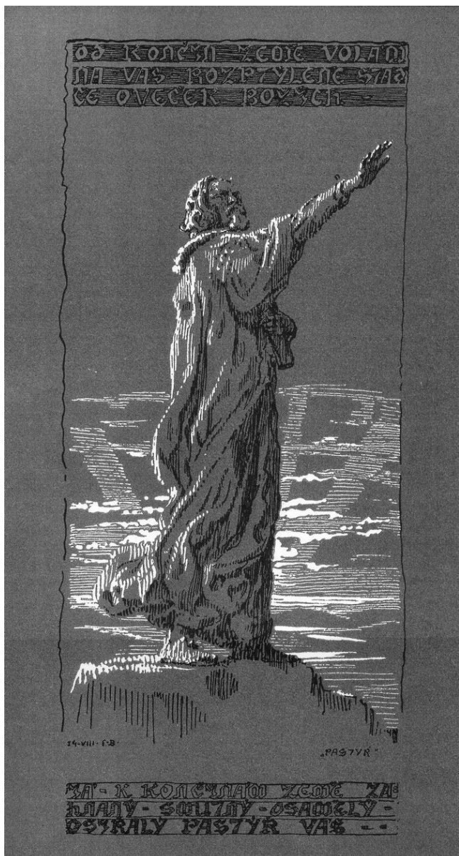
Kresba „Pastýř“ k dílu Smutný hlas.