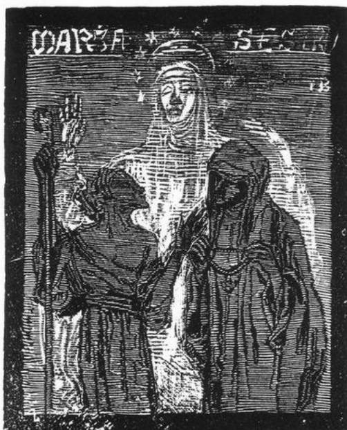
Dřevoryty „Matko“, „Maria matko!“ a „Maria sestro“.