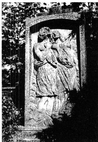
Bože, jen v Tobě jest věčné shledání

sekularizačních tendencí. Vyzdvihl i to, že vzájemnému prokazování svrchované úcty neubralo na věrnosti nic z odlišných úsudků pramenících z rodové religiózní dispozice nebo z tíživých úkonů povolání. Protože oba – navzájem na sebe hrdí, věčně meditující umělci činu, třebaže rigorózní spiritualisté – žili a tvořili v Pravdě. Takové připomenutí jejich společné pouti z vnějšího světa k Bohu, jenž jim byl jedinou jistotou, si dnes zaslouží opětovně pozornosti.