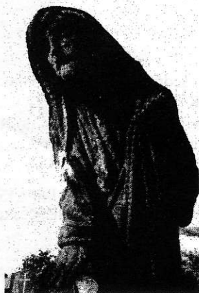
Náš přítel spí, jdu jej ze sna probudit

V textu byly použity fotografie Jiřího Kdera Bílkových náhrobků z Libčic.